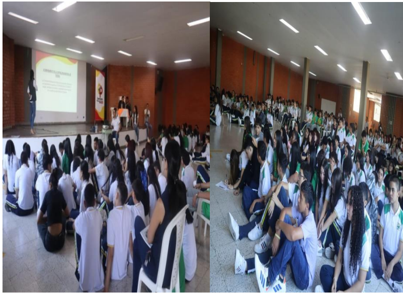
Registro fotográfico I.E La Palmilla I.E Alfonso Jaramillo