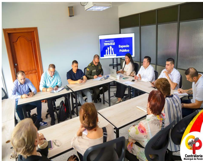
Registro fotográfico Mesas de Dialogo Institucional