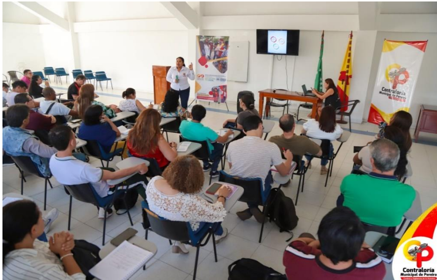
Registro fotográfico capacitación proceso de Elección Contralores y Personeros Estudiantiles